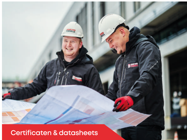
Certificaten & datasheets

In de afgelopen 25 jaar hebben we meer dan 7,5 miljoen vierkante meter aan betonoppervlakken behandeld met Ashford Formula. Onze toonaangevende oplossingen hebben een sterke reputatie opgebouwd bij vooraanstaande architecten, aannemers, vloerenbedrijven en opdrachtgevers, die overtuigd zijn van onze ongeëvenaarde prestaties.