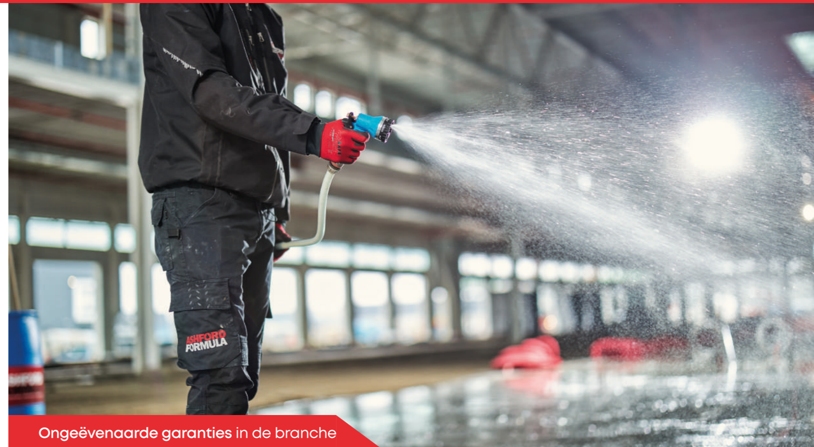
Ongeëvenaarde garanties in de branche

www.ashfordformula.nl/certificaten-datasheets